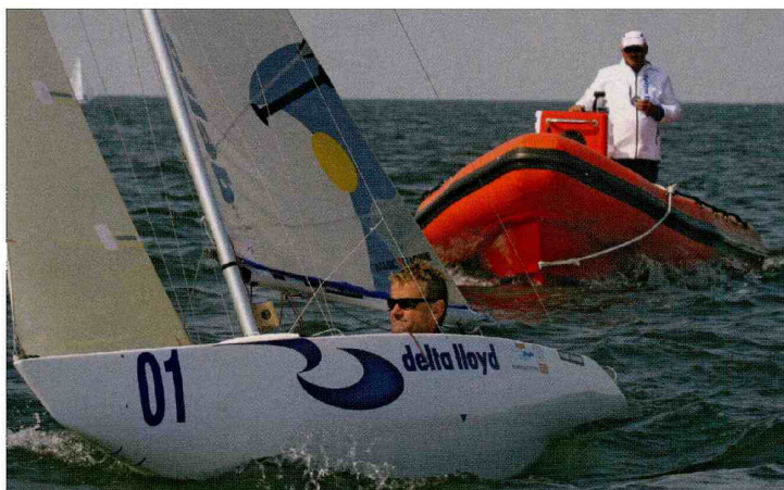
"Beoordeel mij op mijn prestaties, niet op wat ik zeg."